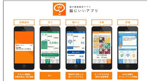
脳の健康維持アプリ「脳にいいアプリ」