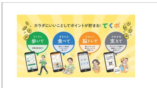
脳にいいアプリ×健康ポイント