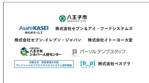
健康に資する商品・サービス事業者