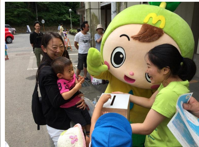
▼ カーボン・オフセットイベントでのオフセット募金活動の様子