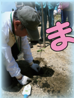
21世紀の森植樹 (尼崎の森中央緑地)