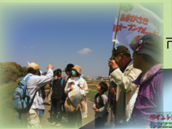
エコあまマップでまち歩き (猪名川河川敷)