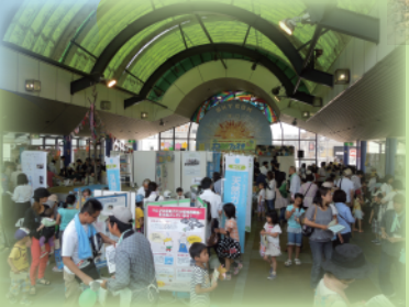
エコあまフェスタ (つかぐちさんさんタウン)