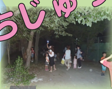
せみの生態観察 (大庄おもしろ広場)