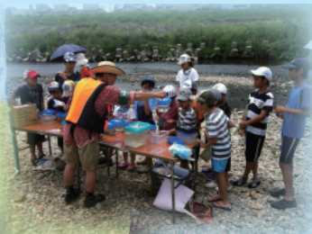
水生生物調査 (藻川)