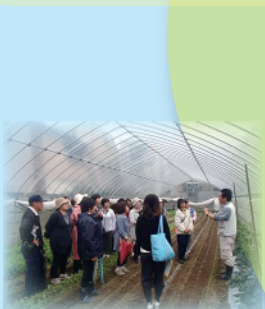
尼崎の農業を知ろう (武庫之荘)