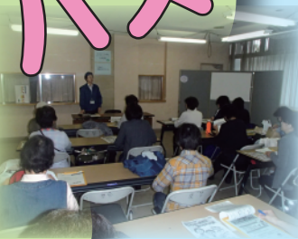
市の取り組みを学ぶ