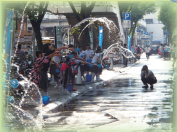
打ち水大作戦 (阪急塚口駅前)