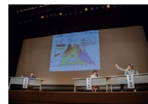
次世代郊外まちづくりフォーラム(たまプラーザ)

相鉄いずみ野線沿線地域 (協定・覚書締結先: 相鉄HD、横浜国立大学、フェリス女学院大学)