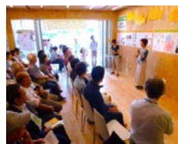
団地の店舗施設を活用した地域活動拠点(洋光台)