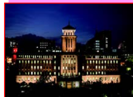
スマートイルミネーション横浜2015 (DNライティング株式会社)