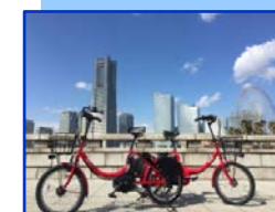
コミュニティサイクル