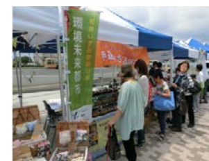
マルシェイベント(相鉄いずみ野駅周辺)

地域・民間事業者・行政・大学等の多様な主体が連携しながら、高齢者・子育て支援や住宅地等再生などの地域課題の解決に取り組み、持続可能な魅力あるまちづくりのモデルを創出。