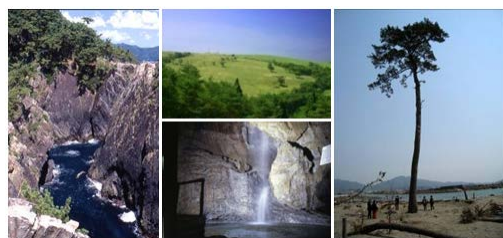
左:大船渡市 碁石海岸 中:住田町 (上)種山ヶ原 (下)滝観洞 右:陸前高田市 奇跡の一本松