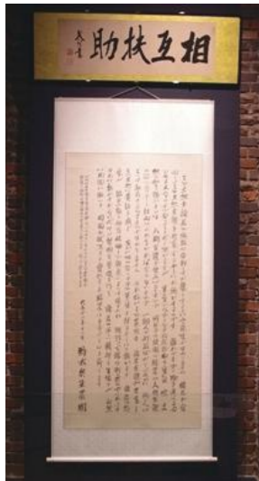
受け継がれる「相互扶助」精神 ニセコ町の人々の意識の根幹には、互いに助け合う「相互扶助」の精神が宿っている。札幌農学校を経て開拓者としてニセコに入った白樺派の作家有島武郎が自分の農場「有島農場」を人々に解放した際に残したこの言葉は、現在のまちづくりの理念にもつながっている。