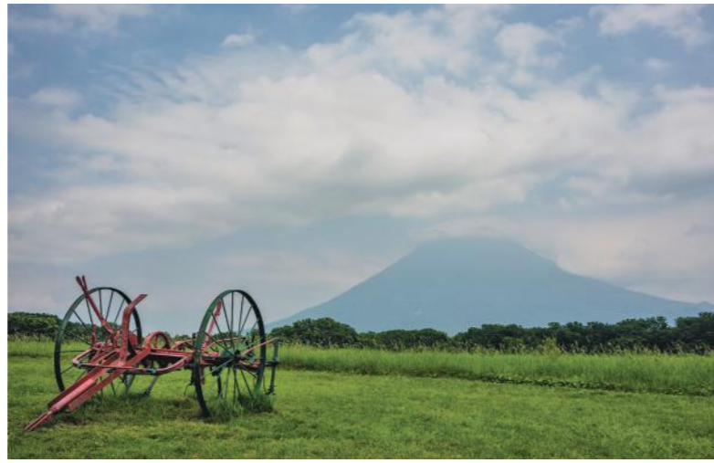
条例で保護された環境が、Iターン者を呼ぶ ニセコ町は 197.1 km 2 のエリアに人口およそ 5,000人。最近では外国人も含めて他地域から移住する人たちが増え、人口は微増傾向にある。環境対策はもとより、住民自治を真ん中に置いた条例規制と地道な取組みが、人口増というプラスのスパイラルを生む。