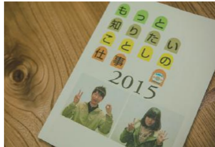
財政民主主義 「もっと知りたいことしの仕事」 情報共有は徹底した情報公開が基礎となる。平成8年から毎年、予算説明資料「もっと知りたいことしの仕事」を全世帯に配布。町民すべてが行政予算を詳細まで把握できる。片山町長は「財政民主主義」と呼ぶ。ネットでもダイジェストを見ることが出来る。 http://www.town.niseko.lg.jp/machitsukuri/joho/post_38.html