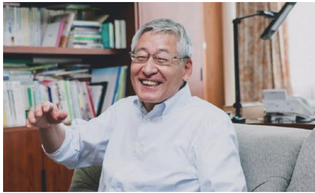
ニセコ町長 片山健也 1953年生まれ。1978年からニセコ町役場に。環境衛生課長、企画環境課長などを歴任し、2009年から現職。住民主導の先進的な取組みにより、循環型社会の実現に向けて奮闘する。