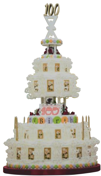
2016年は尼崎市 市制100周年。市庁舎内にはパースディケーキが。

のではなく、環境に取り組むことが経済活動にプラスになるという発想です。製造プロセスでの省エネの徹底、自然エネルギー活用の推進、こうした企業の取組みをエンドユーザーとして応援する消費文化を作ることも大事」と、生活者の意識変革も訴える。 尼崎市の広大な工場跡地は、広大な未来のゆりかごでもある。沿岸部の工場跡地に地元の木を植えて生物多様性の観点から森を再生しよう、と兵庫県と進める『尼崎21世紀の森構想』も順調に進展。「環境モデル都市になってからは、事業者のみならず工場跡地の再開発をパイロットケースとして考えてくれたりと、次の動きが広がっています」という。寄付を元にした尼崎城の再建や、大学跡地を新たな「学びと育ち」の拠点にするプロジェクトも進んでいる。 自転車のもつメリットを最大限に生かす取組みもはじめた。「尼崎は山も坂もない。だから自転車がいっぱい。駅前の放置自転車に目が行きがちだけど、風を切って季節を感じながら楽しめるように、都市の魅力として自転車ネットワークを整備しています」と、尼崎市自転車総合政策推進プロジェクトチームを設置。自転車で楽しむ尼崎を目指して、サイクリングコースの整備も進む。 「環境モデル都市のプレゼンテーション」に向かう新幹線車内で、産業界、行政、市民で本番の練習をしたんです。その時の一体感が、私たちのネットワークを強くしました。環境はまちのDNAにしっかりと継承されています。若き市長の尼崎市への思いを、ベテラン経済人とフットワークのいい市民が固める。