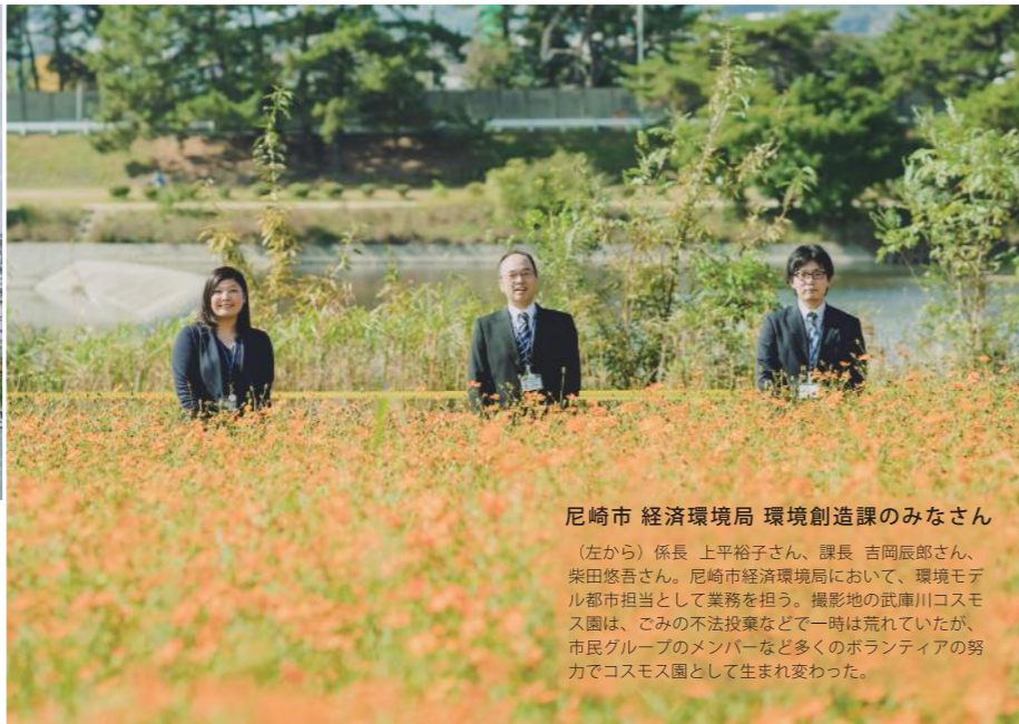
尼崎市 経済環境局 環境創造課のみなさん

尼崎市は、「コンパクトな市域における産業機能・都市機能の集積」が大きな強み。臨海工業地域には先端技術を有する企業が立地。駅前には、商店街などの商業施設、最北部には自然林や田園とさまざまな表情を持つ。