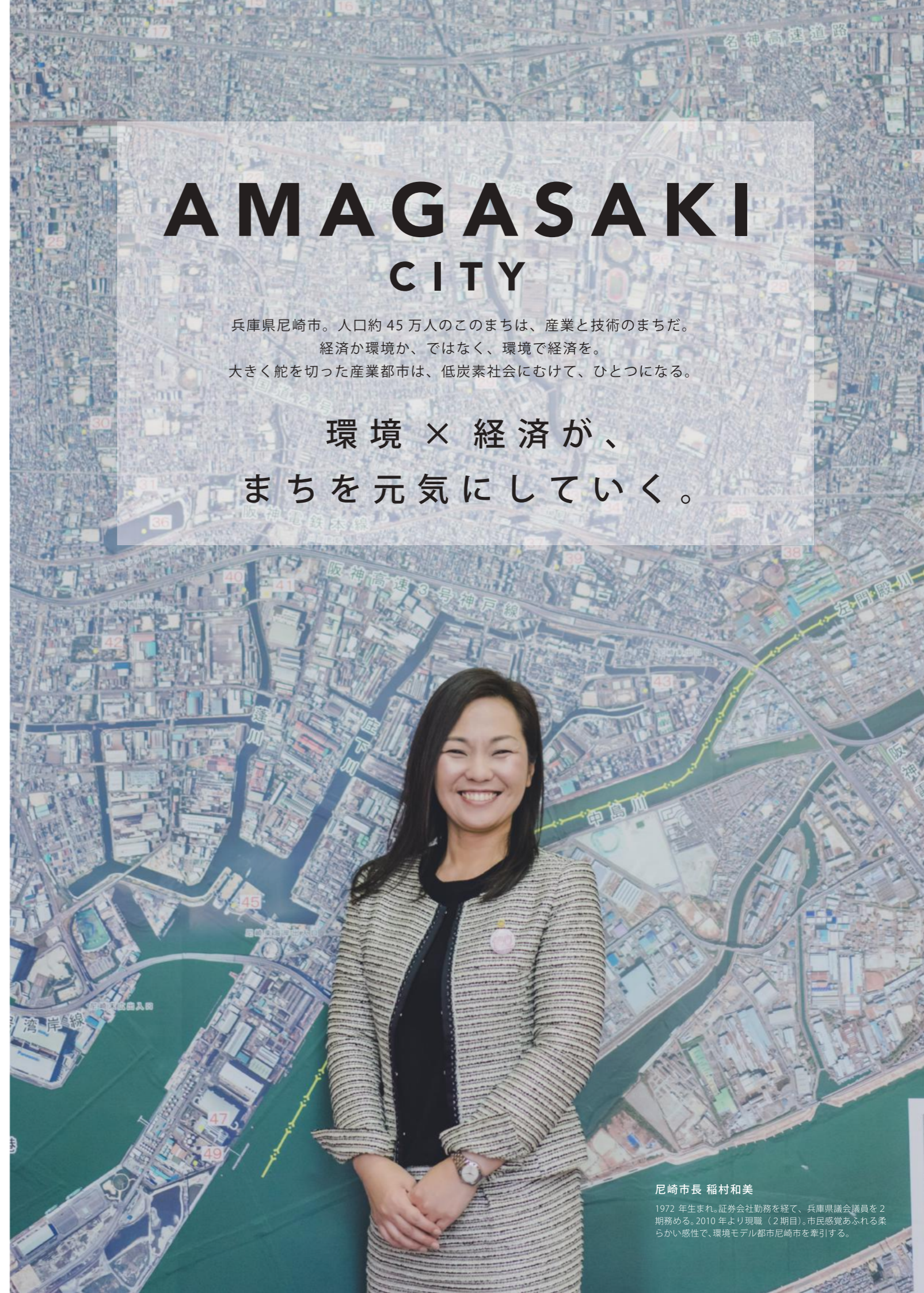
尼崎市長 稲村和美

1972 年生まれ。証券会社勤務を経て、兵庫県議会議員を2期務める。2010 年より現職（2 期目）。市民感覚あふれる柔らかな感性で、環境モデル都市尼崎市を牽引する。