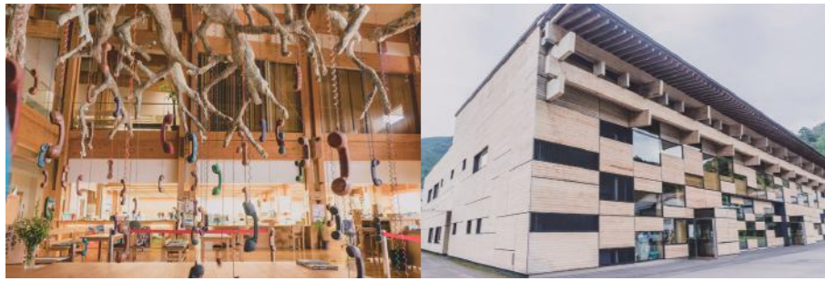
建築家隈研吾さんデザインによる、梶原町総合庁舎

(右) 庁舎外観。「越知面区」「四万川区」「東区」「西区」「初瀬区」「松原区」6地区が支え合う梶原町のセンター機能を持つ。建築家隈研吾さんの設計で、建材には梶原町産のスキの集成材が使われている。屋根には80kWの太陽光発電パネルが、地下には地中熱利用のクール・チューブが設けられている。エアコンはなく、クール・チューブの空調で庁舎内は快適なもの。 (左) 庁舎内観。庁舎内に銀行、農協、商工会などの施設も併設。時折開け放たれる半屋外の広場には神楽などが演じられる移動型のステージがあり、アートディレクター森本千絵さんのオブジェ「受話樹」が「ゆすはらびと」の絆を象徴するかのよう展示されている。