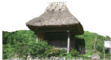
茅葺きの小さな情報交換拠点、茶堂

高知市立商業高等学校卒業後、梶原町役場入庁。産業建設課長、総務課長を経て、副町長を2期務める。2009年12月に梶原町長に就任（現在2期目）。人と自然が共生するまちづくりに取り組む。