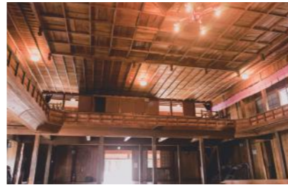
梶原町のシンボル『ゆすはら座』

四万十川源流の梶原川沿いに56の集落が点在する、高知県梶原町。奈良時代から交通の要所であり、「脱藩者」龍馬をもてなした自立の土地。進取の気性に富む「ゆすはらびと」たちは、歴史の継続を目指して、再生可能エネルギーでひとつになる。