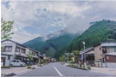
電柱をなくした、美しいまちなみ

1862年、坂本龍馬は土佐藩を脱藩し、梶原で一泊し、この地の勤王の志士とともに下関に向かった。梶原町は、新しいまちづくりをめざす思いを龍馬の高い志と重ね、歩いた道を『龍馬脱藩の道』として残している。