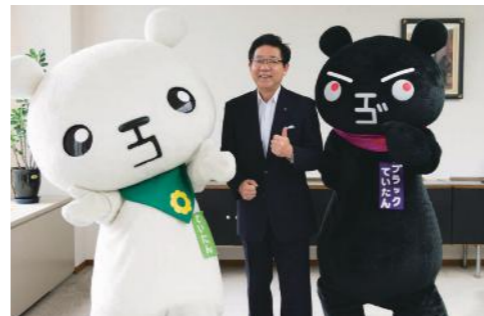
低炭素化推進の環境マスコットキャラクター、ていたん(左)とブラックていたん(右)。ていたんはシロクマがモチーフ