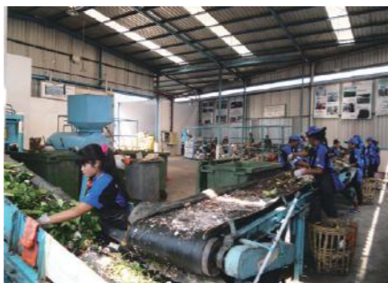
高度な技術ではなく、あくまでも現地の人たちが買えて運用できるシステムを目指す。これが当初からのコンセプトだ。現在ある設備はベルトコンベアとプレス機程度でゴミは人の手で選別している