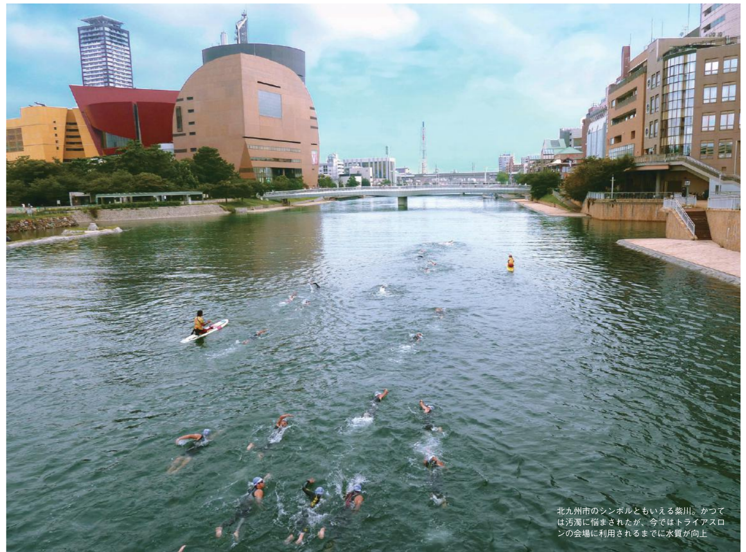
北九州市のシンボルともいえる荒川。かつては汚濁に悩まされたが、今ではトライアスロンの会場に利用されるまでに水質が向上

「もう一度、青い空を取りもどしたい」 そんな主婦たちの願いから始まった、北九州市の公害対策。 そこで培われた「市民環境力」とアジア各都市との連携が、 いま、新たな可能性を切り拓こうとしている。