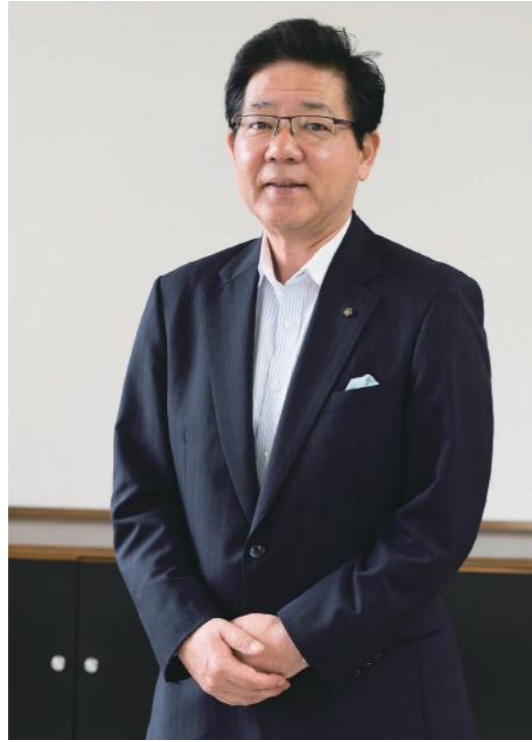
北九州市長 北橋 健治 きたはし けんじ

1953年生まれ。'86年に衆議院議員初当選後、大蔵事務次官、衆議院環境委員長、などを歴任。'07年より現職。「世界の環境都市を目指すことが北九州市の志」との思いから、持続可能な環境都市への施策にも積極的に取り組んでいる