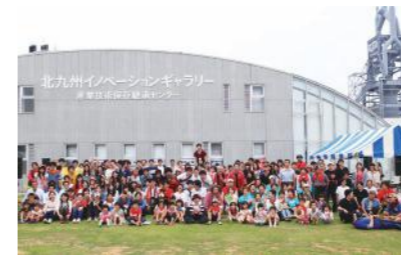
「おもちゃより・おそろけ・わかちあい」をコンセプトに実施している「Share! 東田まつり」も2014年で3回目を迎えた