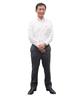
誰かがやらなきゃいけないんです!