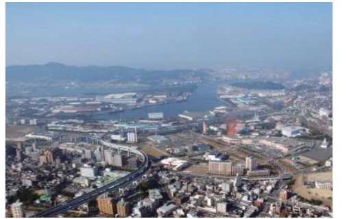
公害問題を克服した北九州市。現在は開発途上国が同じような失敗をしないよう、インフラなどの輸出にも取り組んでいる

こうした地理的条件、歴史的背景もあり、北九州市では、80年から、アジアからの海外研修員受け入れを積極的に行ってきた。現在では、北九州市を研修で訪れた人の数は延べ150カ国、7400人以上にも及ぶという。