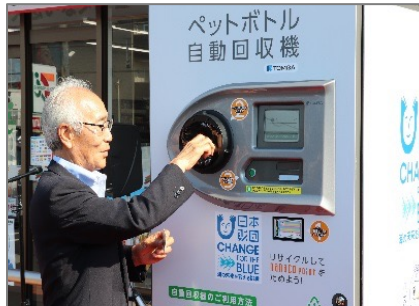
画像（会員投票の際のサムネイル）

【産官民連携による全国初の取組！】 市内セブンイレブン全店舗におけるペットボトル回収事業を実施し、ペットボトルの水平リサイクルを目指す取組です。