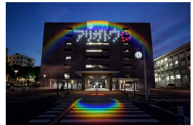
浜松市役所のアリガトウ・ライトアップ