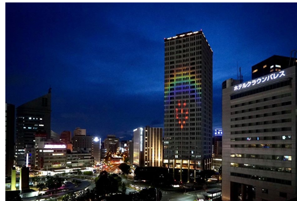
JR浜松駅北口「一条タワー」へのレインボウ・ライトアップ