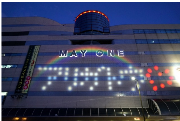
JR浜松駅ビル「メイワン」へのアリガトウ・ライトアップ

ライトアップを見た市民からもエールの声が届き、最前線で闘う医療・介護従事者などの皆様へ想いを繋ぐ架け橋になることができました。