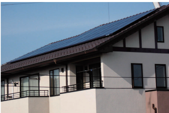
自分たちが使う電気はできるだけ自分たちで作る。町を歩くと、家庭用ソーラーパネルの普及率に驚かされる

「長い時間から見れば、われわれが生きてるのは一コマに過ぎない。先達の人たちに支えられて連綿とつないでもらった命なんだから、どうやって次の未来にもうちょっといい形でつないでいかかを考えたい」 さすがは1000余年の歴史ある野馬追の里の長、スケールが大きい。