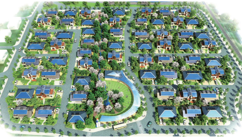
奥野翔建築研究所が共同で提案した「市街地立地型コミュニティユニットと水利用によるスマートコミュニティ」