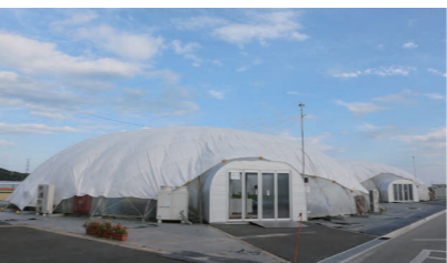
隣接する太陽光発電で昼間の電力をまかなう円形ドームの植物工場