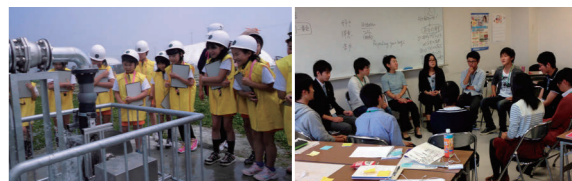
左/水力発電体験装置でエコエネルギーについて学び、考える力を養う児童たち 右/週末オープンスクールで意見を出し合う高校生たち