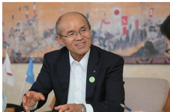
「特にご婦人方は元気だね。輝いて見えるもの。そういう輝く人が増えていけば、南相馬っていい所だなんてみんな思うよ」