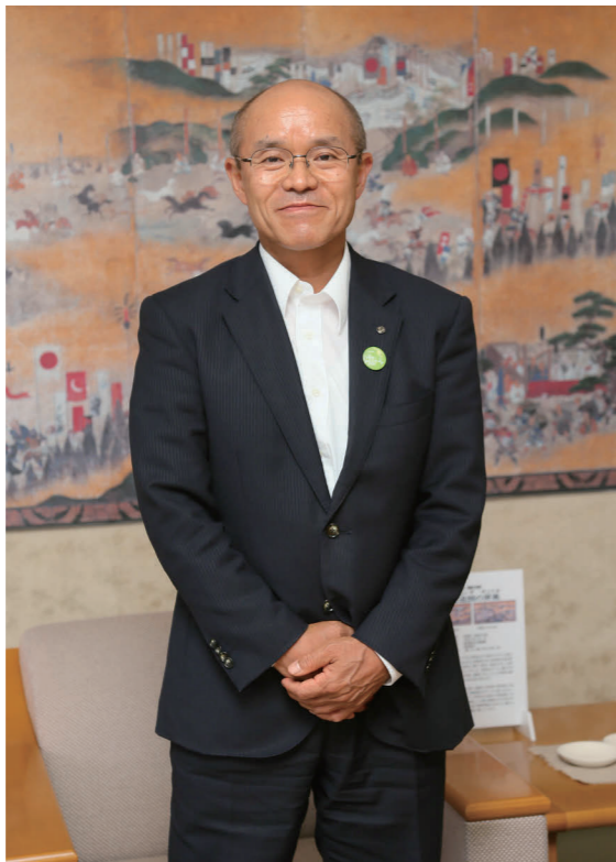
南相馬市長 桜井勝延 さくらい・かつのぶ

1956年1月4日生まれ。福島県南相馬市原町区江井出身。岩手大学農学部卒業後、農業に従事。2003年より原町市議会議員、2006年より南相馬市議会議員。2010年より南相馬市長。2期目。震災直後、被災した南相馬市の窮状をインターネット等で全世界に積極的に訴え、米国タイム誌の2011年「世界で最も影響力のある100人」に選ばれた。