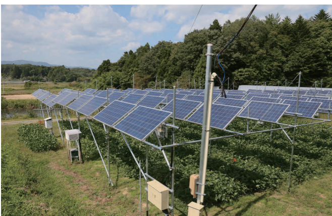
再エネの里のソーラーシェアリング。ソーラーパネルの遮光率は約30%で、地面にも光が届くため営農を継続できるのが最大の特長

た。再生可能エネルギーと農業を共存する道を探る「えこえね南相馬」としての活動が始まった。ビニールハウスでの水耕栽培なども試したが、やはり農家の人たちからは「土を触りたい」という声が圧倒的だった。そ