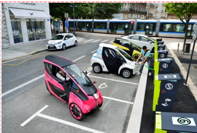
Ha:moステーションの様子(仏・グルノーブル)