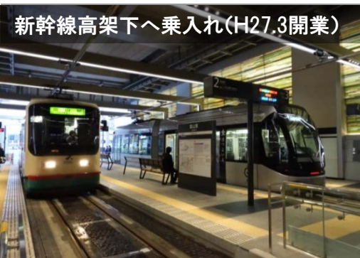
新幹線高架下へ乗入れ(H27.3開業)