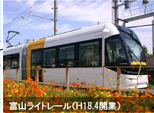
富山ライトレール(H18.4開業)