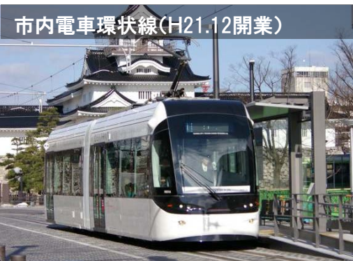
市内電車環状線(H21.12開業)

LRTネットワークの形成により、過度に車に依存したライフスタイルを見直し、歩いて暮らせるまちづくりを進めることで、環境や高齢化の課題にも対応した持続可能な都市を実現。