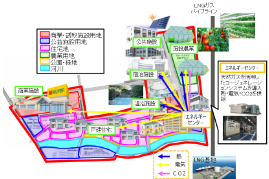
新地駅周辺まちづくりと地域エネルギー事業のイメージ

駅周辺エリアの東側に整備される天然ガスパイプラインから分岐して天然ガスを引き込み、コージェネレーションシステムにより駅周辺施設へ熱と電気を供給するとともに、トリジェネレーションにより農業生産施設へCO 2 を供給をする「自律分散型・地域エネルギーシステム」の事業化を目指している。