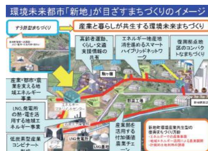
環境未来都市「新地」が目指すまちづくりのイメージ

環境都市の暮らしと産業の実現の観点から、産学官が連携したネットワークを形成し、環境関連産業に係る情報交換などの場を創出。地域エネルギーの利活用調査や事業化検討、持続可能な環境都市の暮らしの実現に向けた調査研究を行っていく。