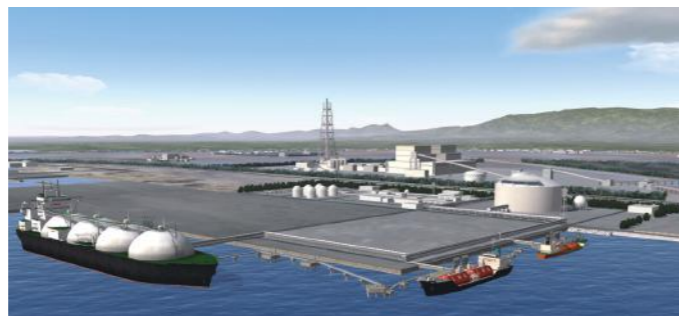
相馬LNG基地イメージ。20ヘクタールの敷地に地上式23万キロリットルの貯槽1基

平成 25 年 11 月、石油資源開発株式会社と県と町との間で、相馬港における LNG 基地立地計画を円滑に促進することを目的とした基本協定が締結された。相馬港で LNG 基地建設計画が進んでおり、地域エネルギーの利活用検討やエネルギー関連産業の集積促進など、エネルギー地産地消のまちづくりを計画。天然ガスの新規大量供給に伴う地域産業誘致・雇用創出など関連産業創出の可能性に期待が高まっている。