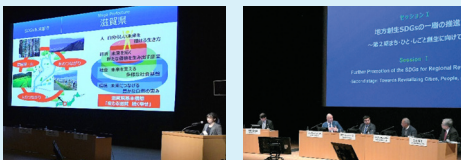
本プラットフォームと内閣府の共催で、地方創生SDGs国際フォーラムを開催しております(写真は、地方創生SDGs国際フォーラム2020の開催時の様子です)。